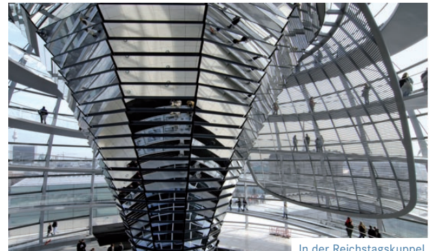
In der Reichstagskuppel

Oranienburger Straße oder die angrenzenden Hackeschen Höfe sind erste Adressen in Mitte, um zu schlendern und zu schauen, zu essen und etwas trinken zu gehen. Auch im Prenzlauer Berg lässt es sich gut bummeln am Käthe-Kollwitz-Platz oder in der Kastanienallee, in Friedrichshain ist es die Simon-Dach-Straße, die Touristen wie Einwohner anzieht. Multikulturell geht es in Kreuzberg zu. Hier ist die Gegend um die Oranienstraße (U-Bhf Kottbusser Tor) und der Bergmannstraßen-Kiez mit der 100 Jahre alten Markthalle zu empfehlen.