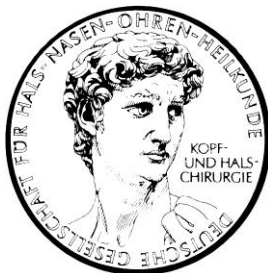
Deutsche Gesellschaft für Hals- Nasen- Ohren- Heilkunde, Kopf- und Hals- Chirurgie e.V. (DGHNO-KHC)