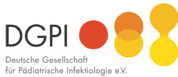
Deutsche Gesellschaft für Pädiatrische Infektiologie e.V. (DGPI)