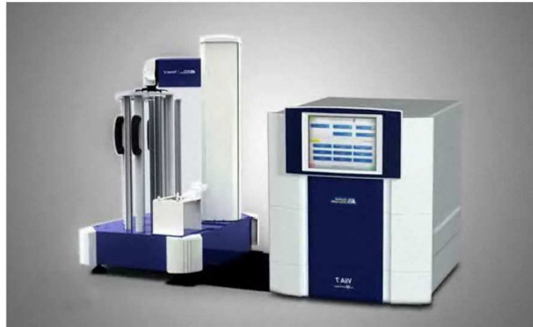
Quantifizierung von TRECs und KRECs